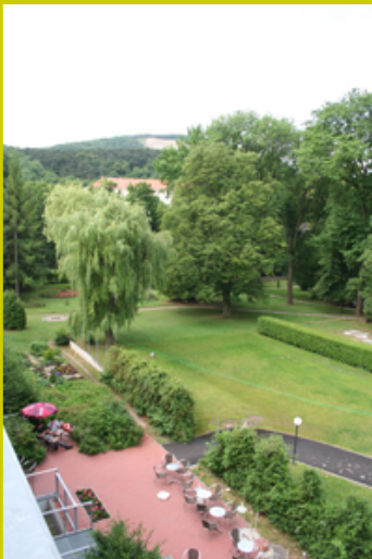
Parkanlage des Anton Proksch Instituts