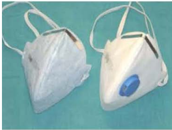
Patienten: ohne Expirationsventil Personal: mit Expirationsventil