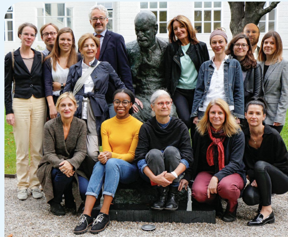
Das Team der Universitätsklinik für Psychoanalyse und Psychotherapie

Eingerahmt und geschmückt wird unsere Feier durch musikalische und literarische Kostbarkeiten – unter anderem mit einem besonderen persönlichen Bezug.